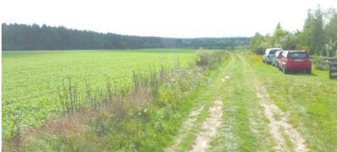
Widok na teren z drogi dojazdowej.