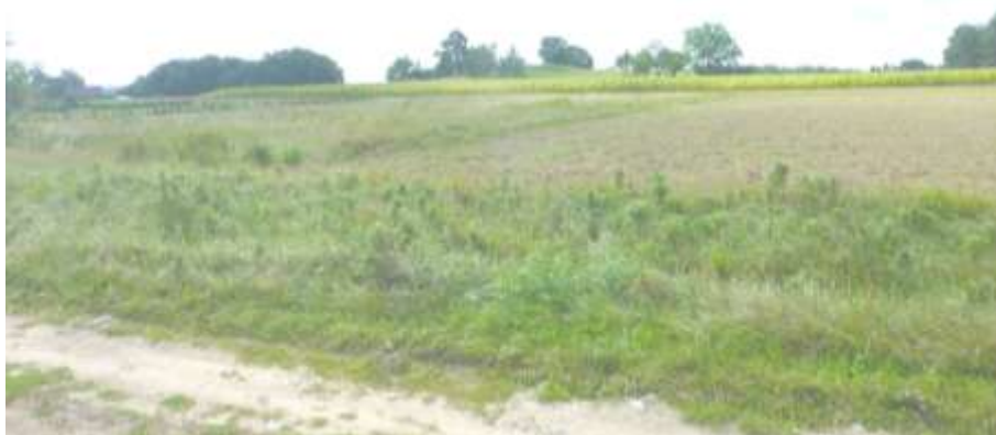
Widok na teren z gruntowej drogi dojazdowej.