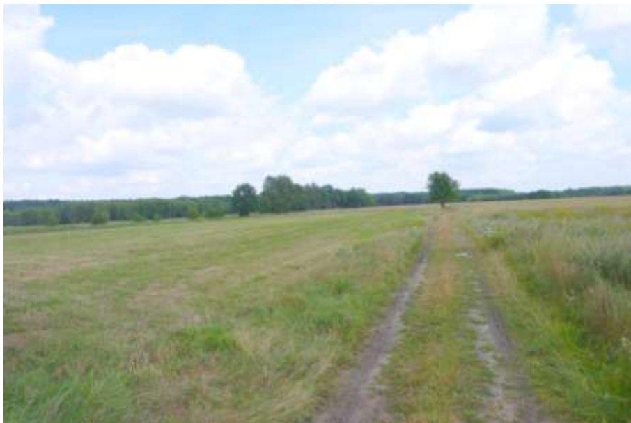
Widok od strony polnej drogi dojazdowej