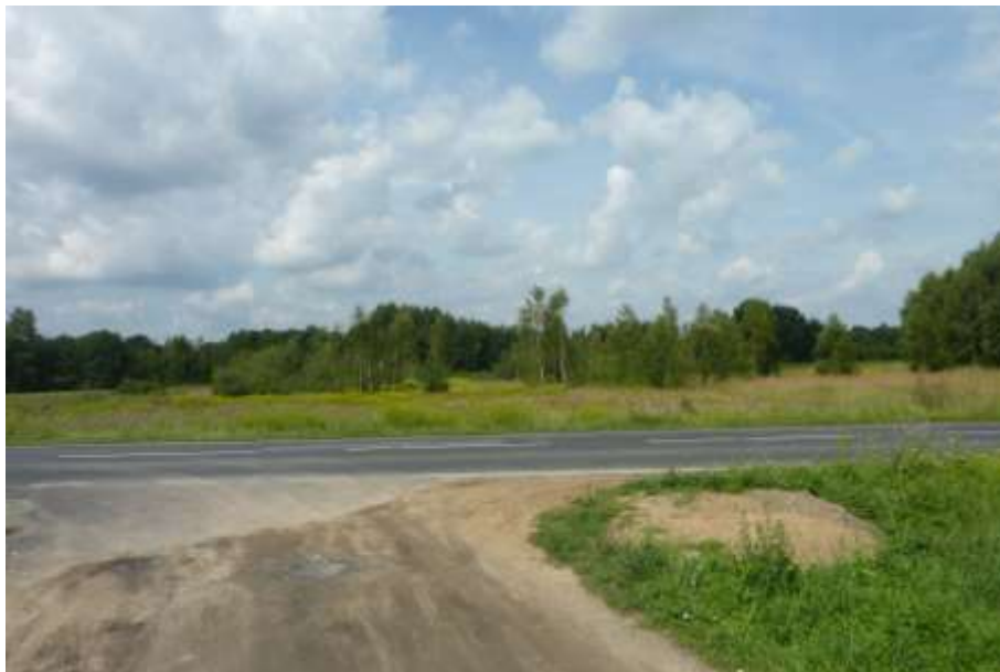
Widok z ul. Krotoszyńskiej.