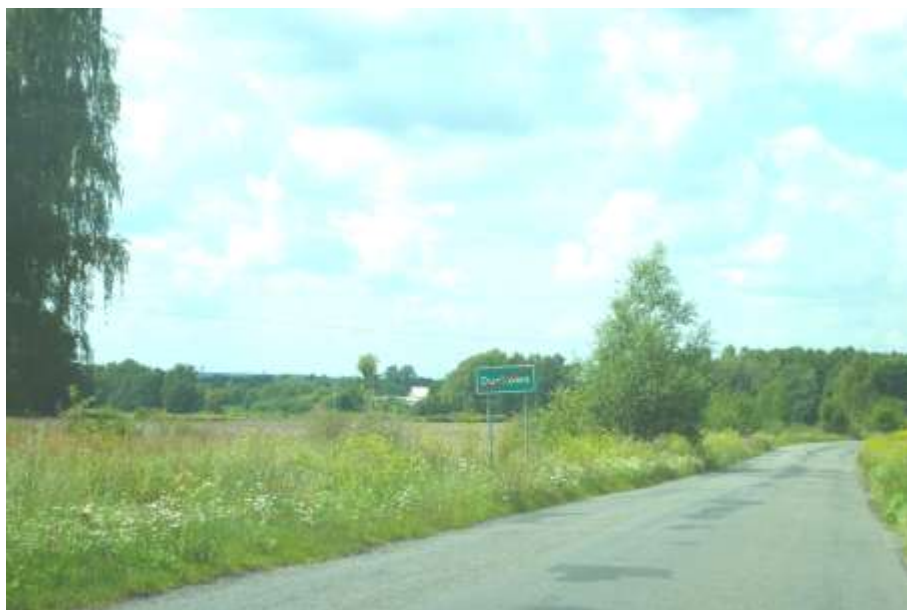
1 Widok na teren przemysłowy od strony drogi powiatowej.