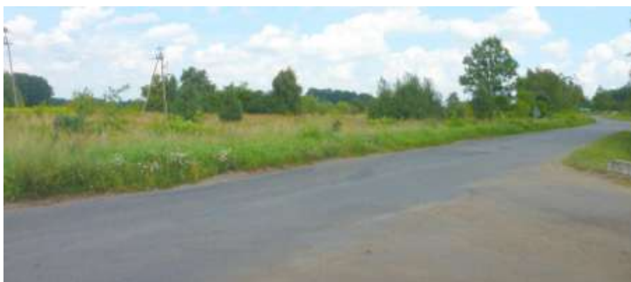
. Widok na teren przemysłowy od strony drogi powiatowej.