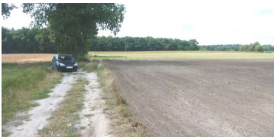
Widok na teren w kierunku zachodnim.