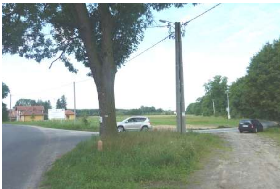
Widok od strony północnej.