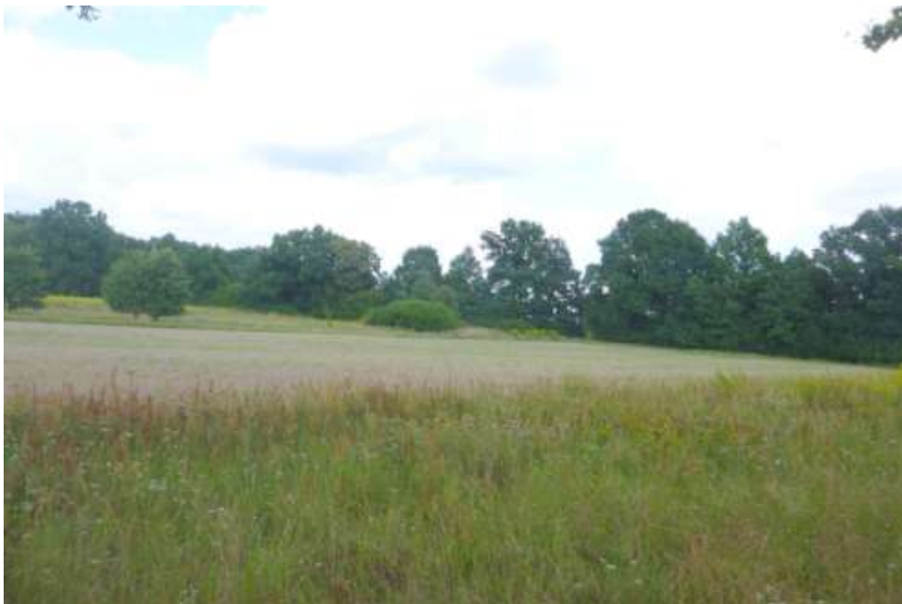
Widok na teren przemysłowy.