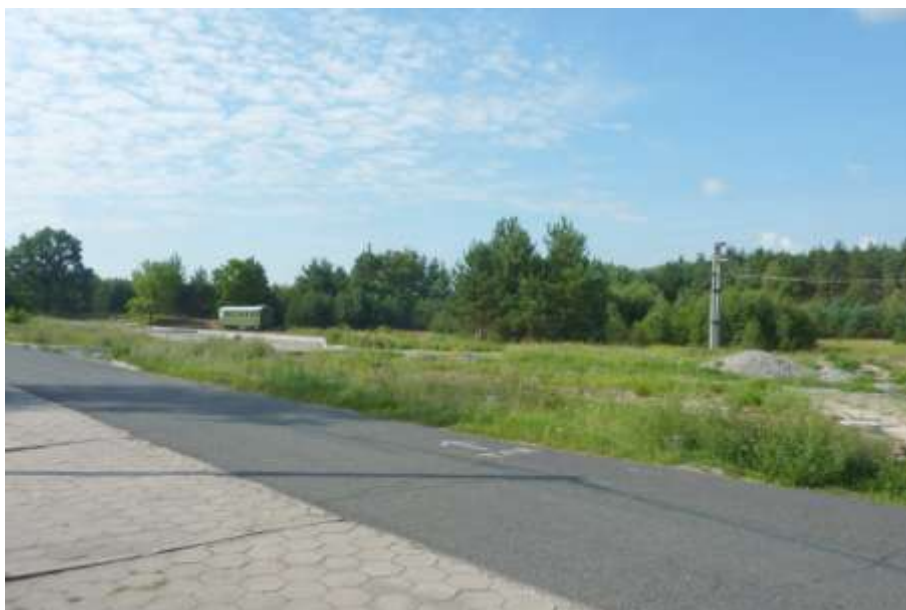
Widok od strony ul. Kolejowej - obszar oferty w głębi za linia energetyczną.