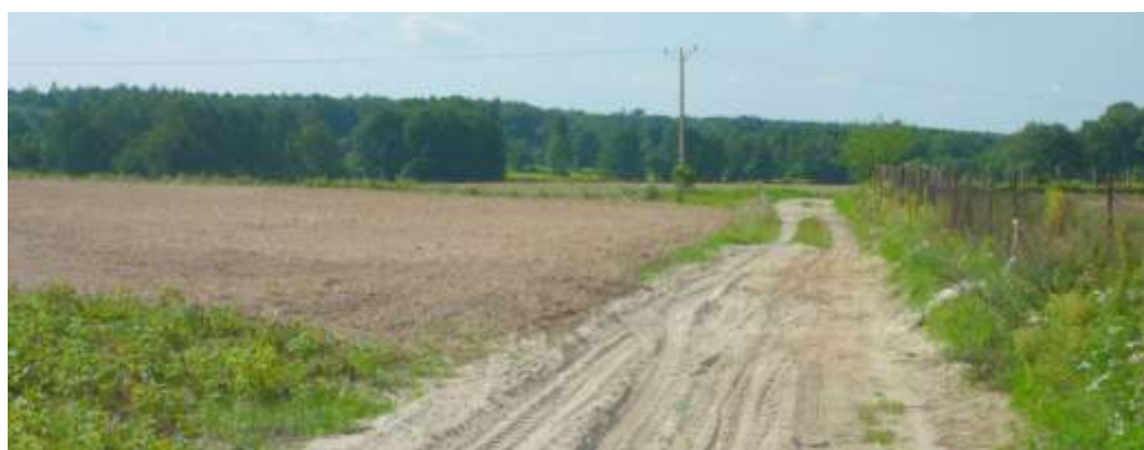
Widok na teren z drogi gruntowej.