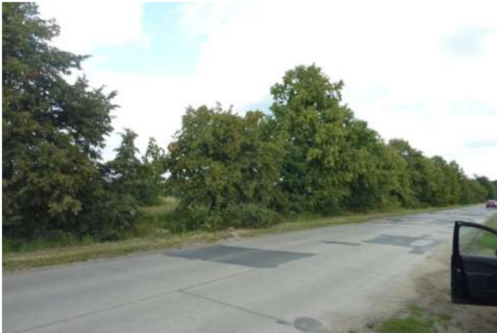
Widok z ul. Powstańców Wielkopolskich.