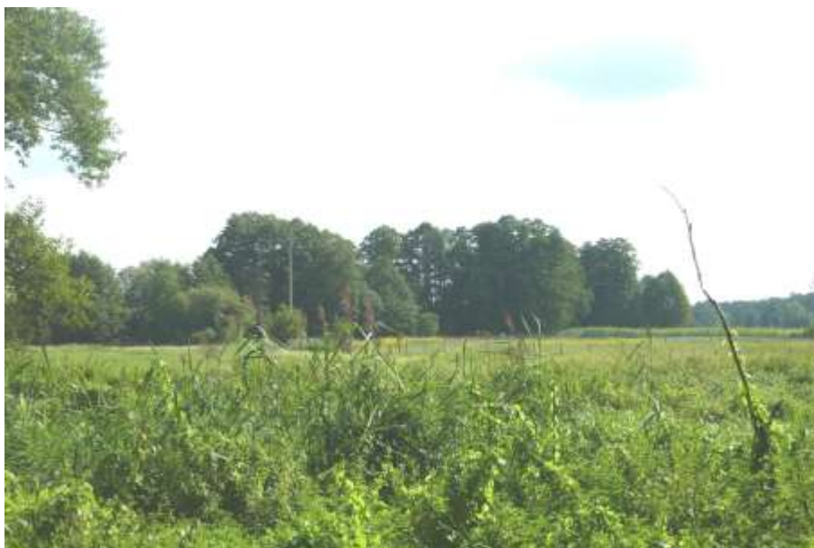
Widok od strony ośrodka wypoczynkowego.