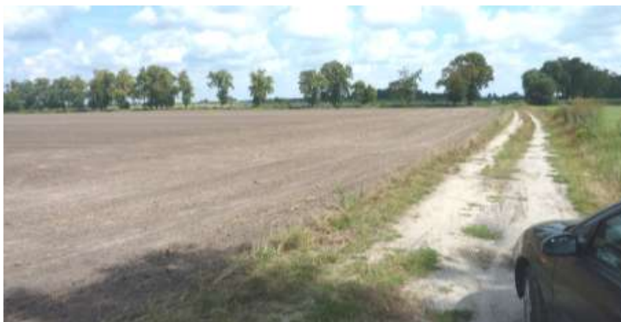
Widok na teren w kierunku wschodnim.