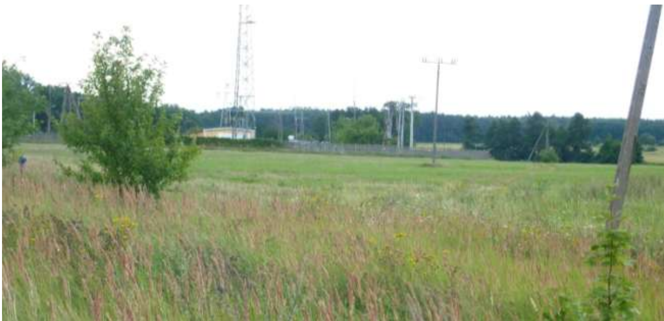
Widok na teren przemysłowy z ul. Powstańców Wielkopolskich.