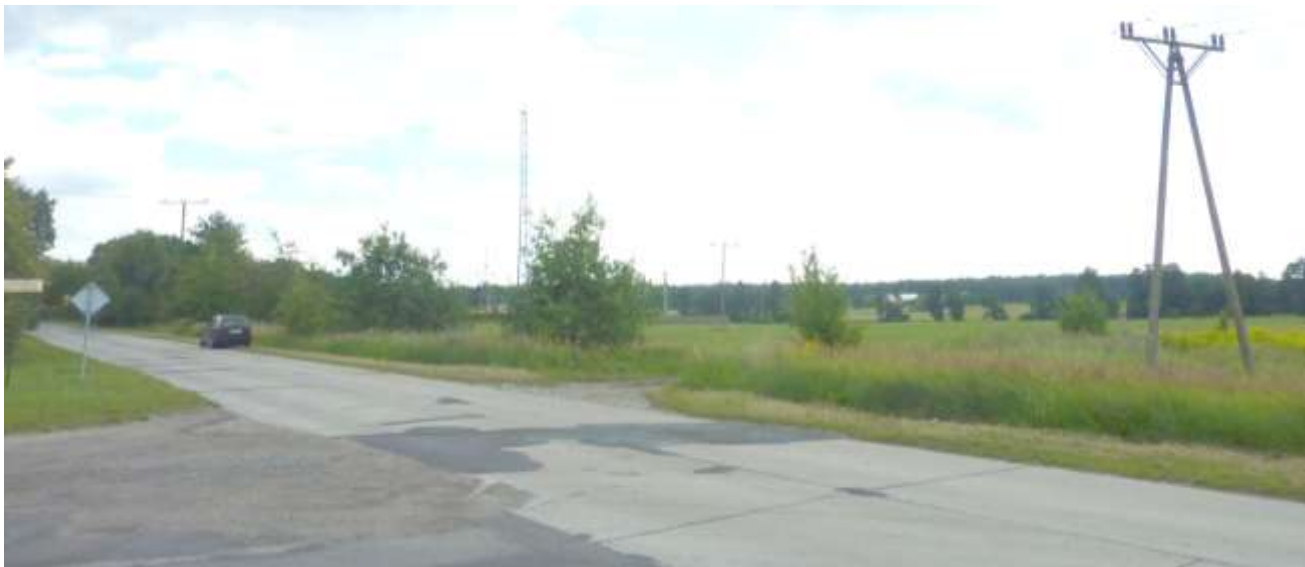
Widok na teren przemysłowy z ul. Powstańców Wielkopolskich.