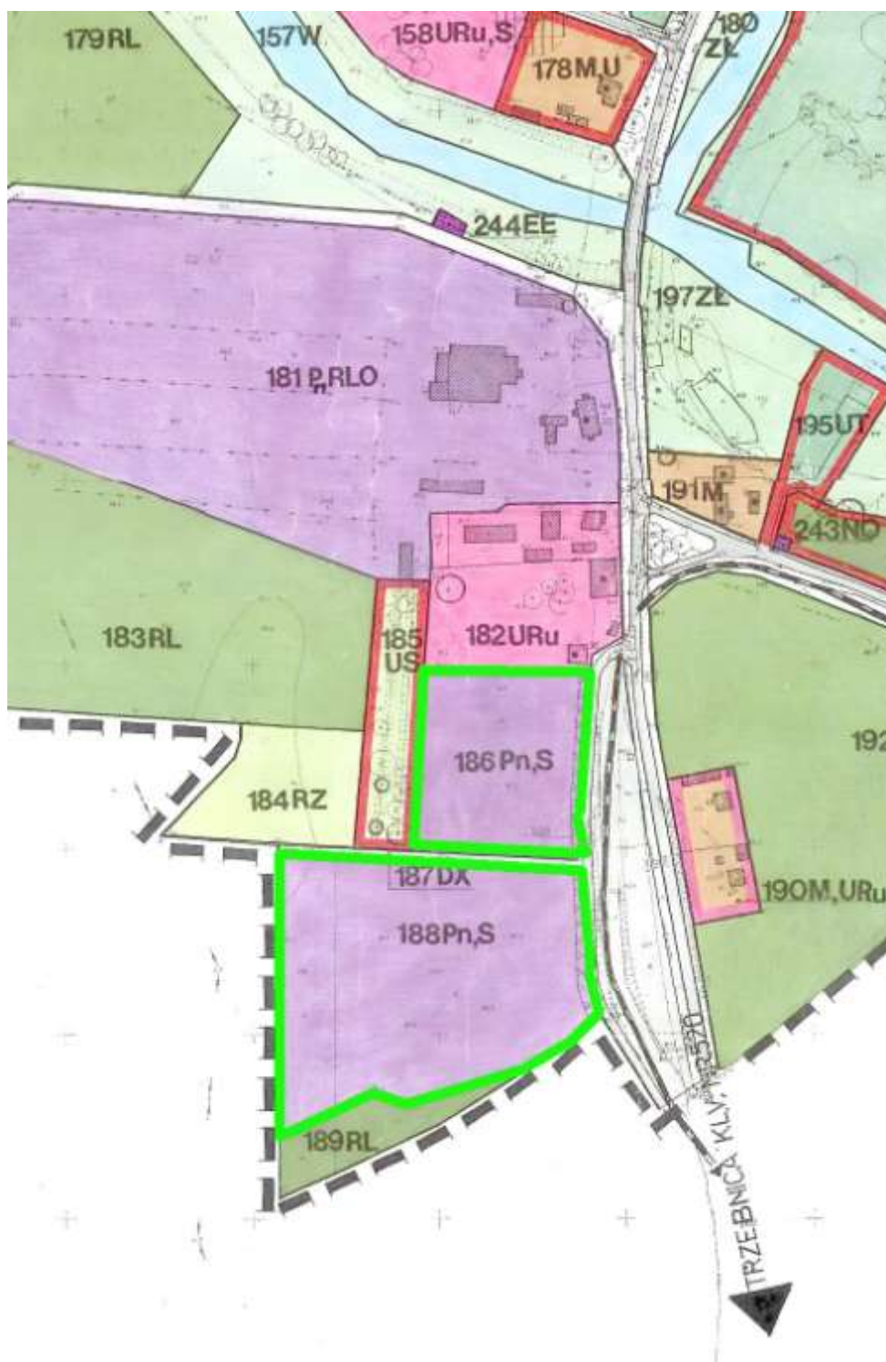
Wyrys z planu miejscowego.