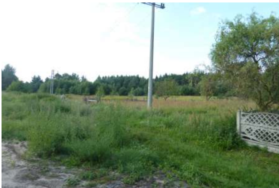
Widok od strony północnej.