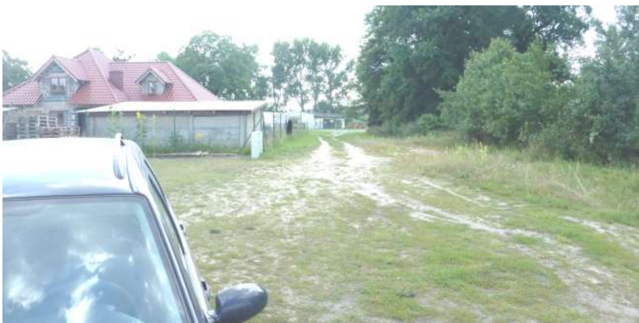
Widok na gruntową drogę dojazdową.