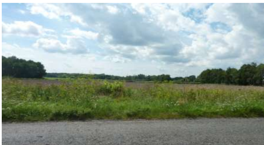
1 Widok na teren przemysłowy od strony drogi powiatowej.