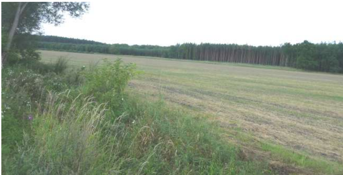
Widok na teren od strony południowej.