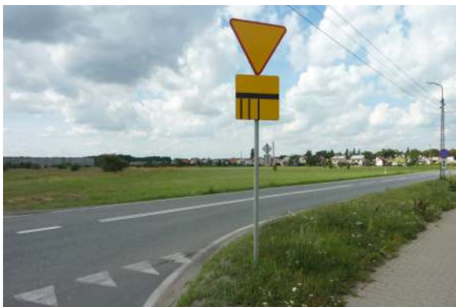
Widok od strony ul. Trzebnickiej.