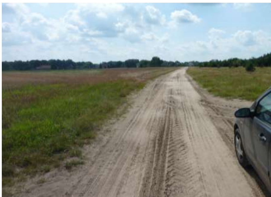
Widok na drogę dojazdową w kierunku południowym.