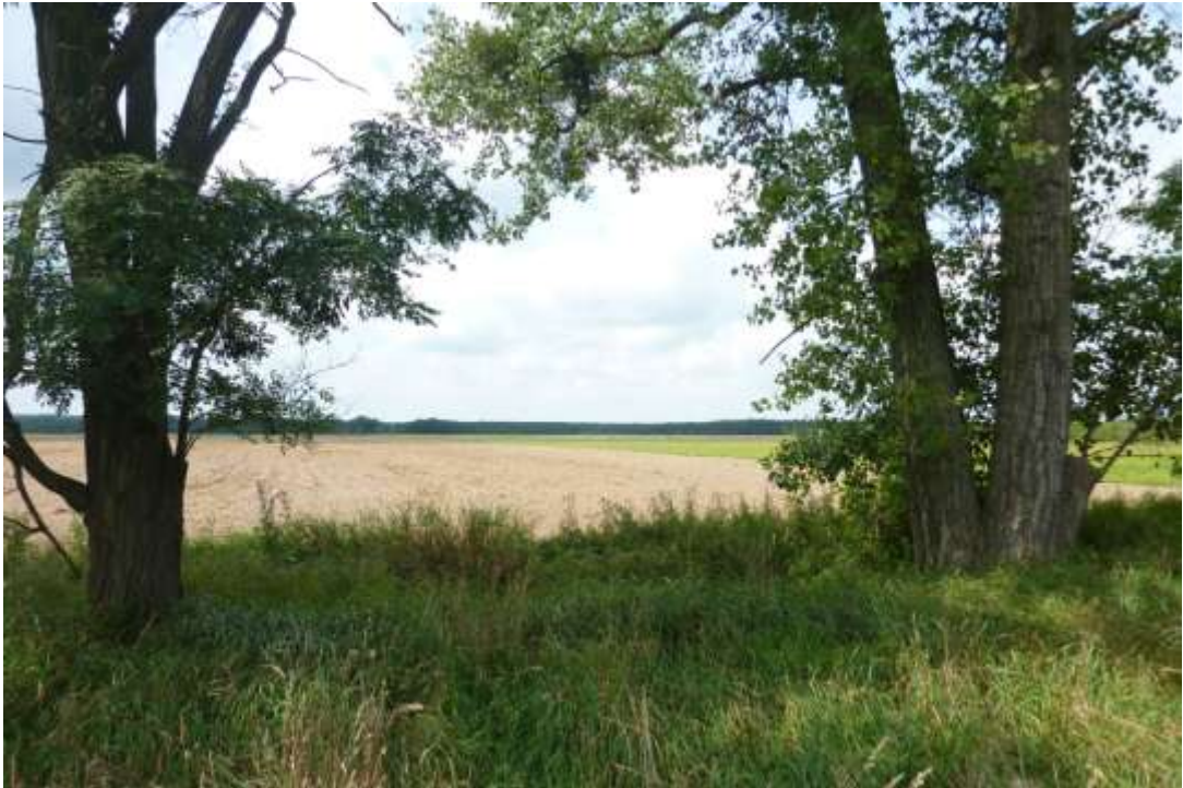
Widok od strony wschodniej.