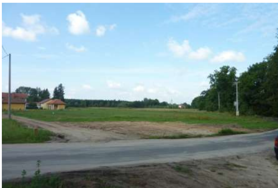
Widok od strony północnej.