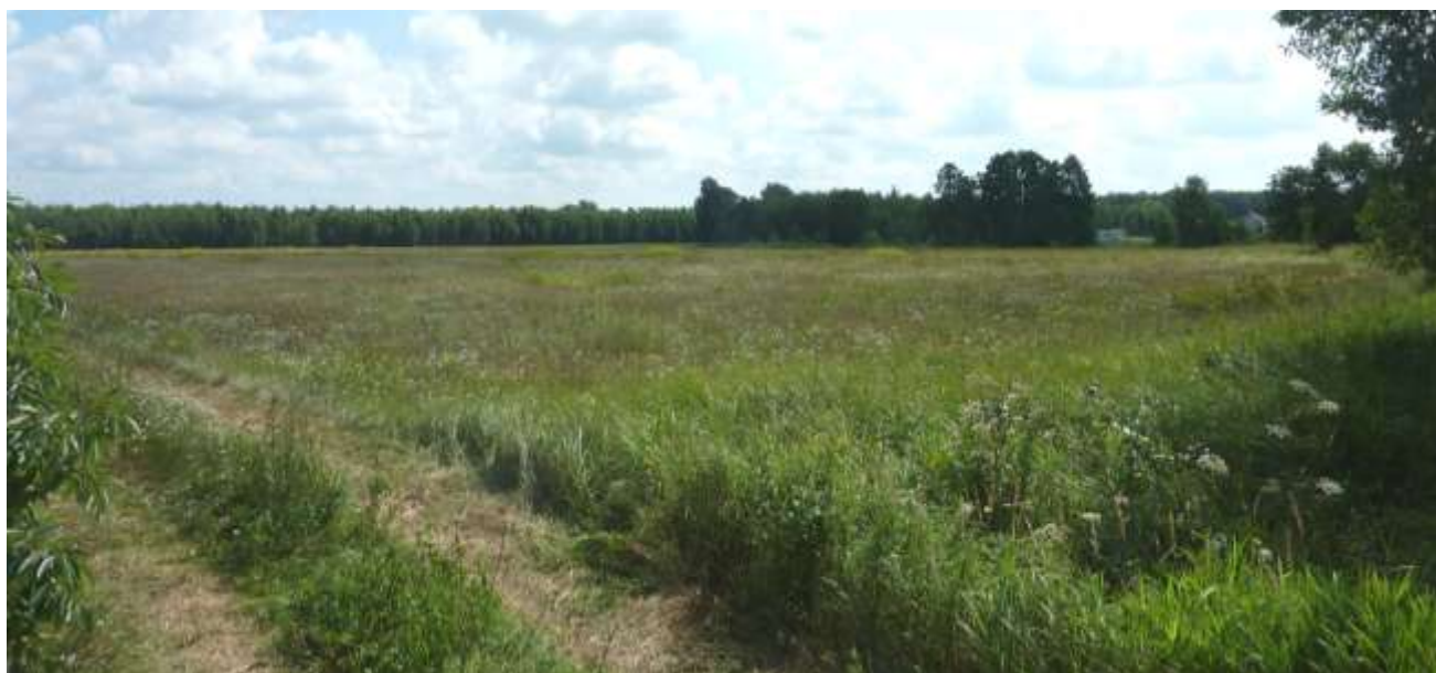
Widok od strony północnej