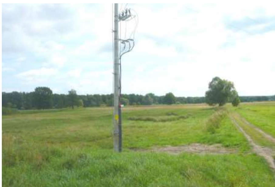
Widok na teren z gruntowej drogi dojazdowej.