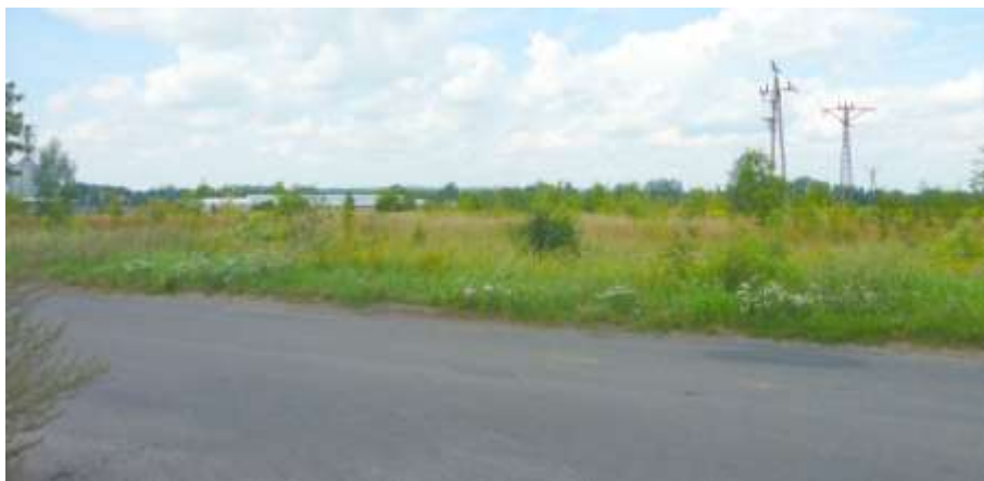
. Widok na teren przemysłowy od strony drogi powiatowej.