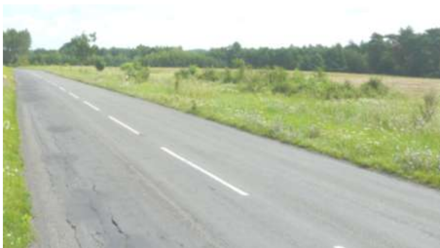
Widok na teren z drogi wojewódzkiej.