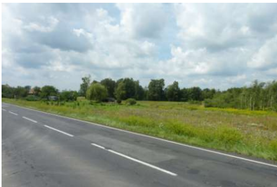
Widok z ul. Krotoszyńskiej