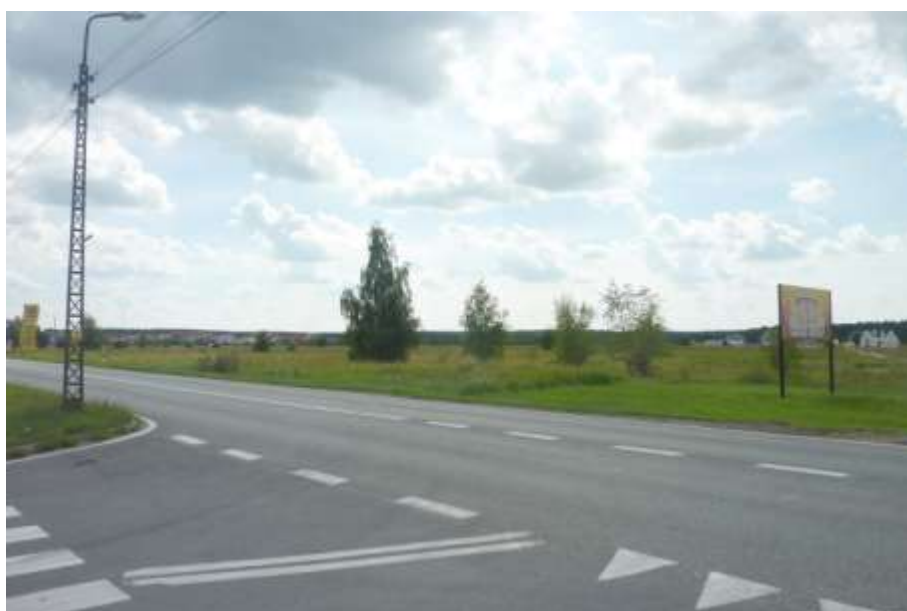
Widok od strony ul. Trzebnickiej.