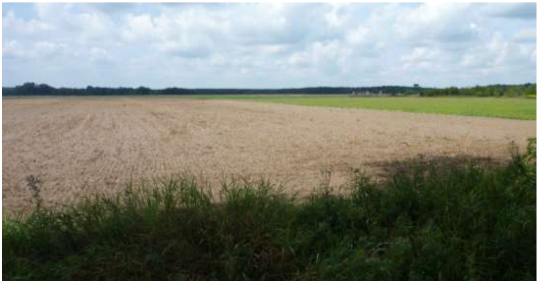
Widok od strony wschodniej.