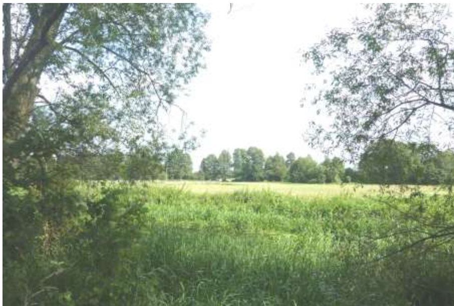
Widok od strony ośrodka wypoczynkowego.