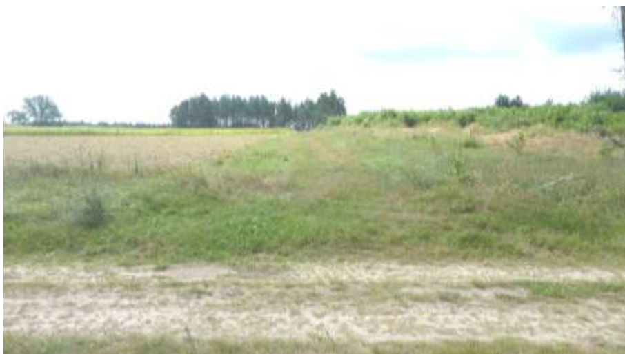
Widok na projektowaną drogę KD przy zachodniej granicy terenu.