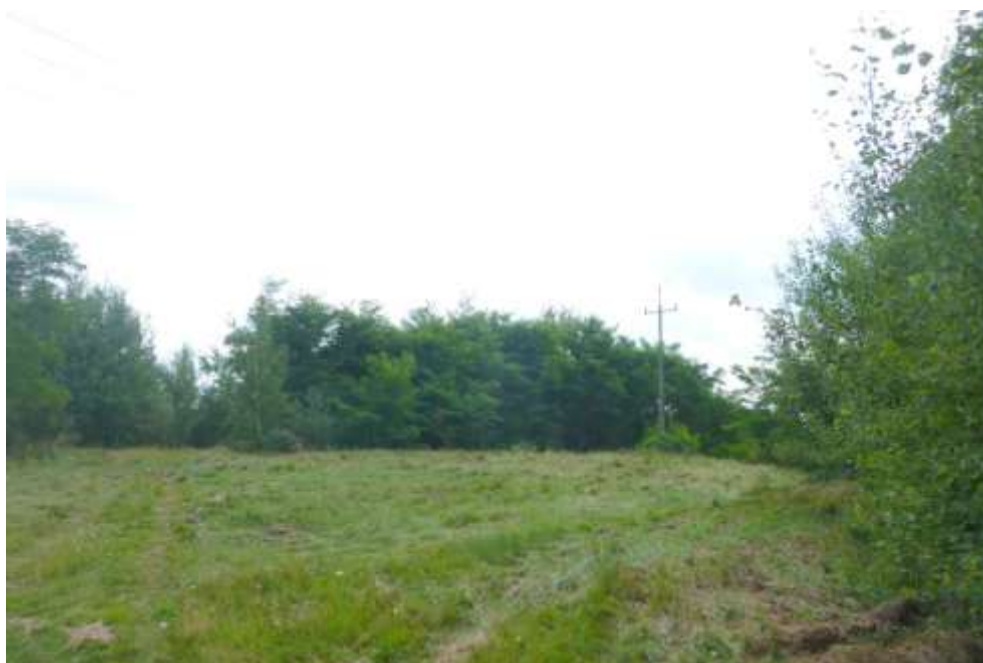
Widok na południową część terenu.