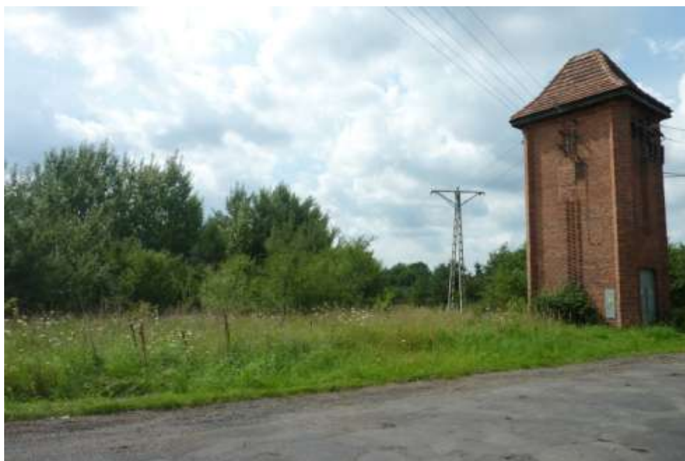
Widok od strony północnej.