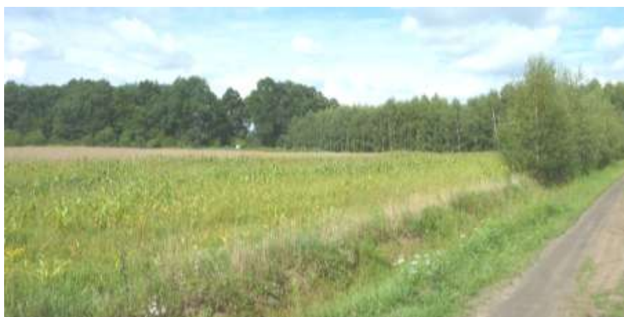
1 Widok na teren.