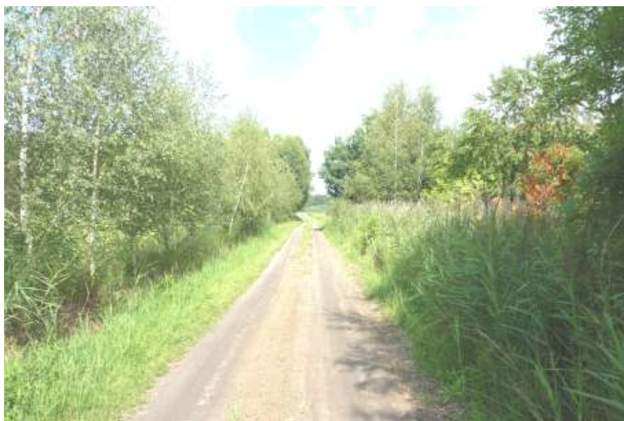
Widok na drogę dojazdową.