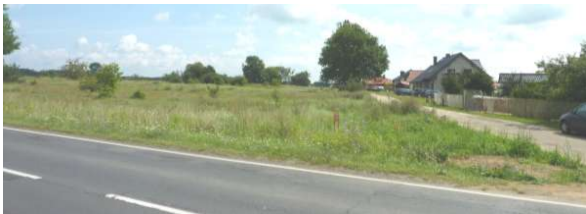
Widok od strony ul. Krotoszyńskiej na południową część terenu.