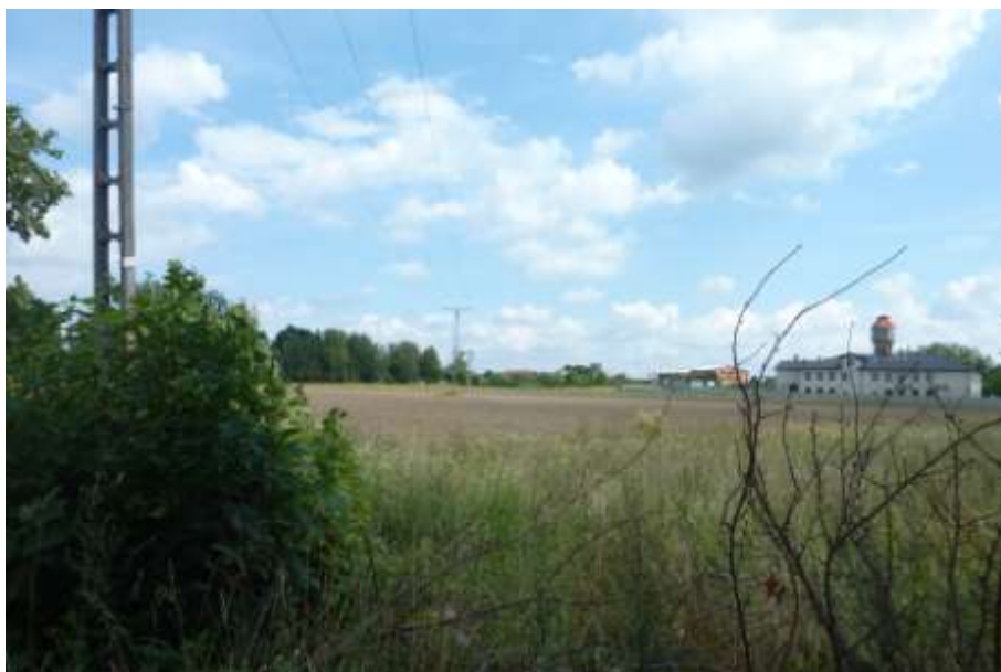
Widok od strony północnej.