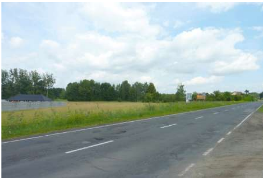
Widok z ul. Krotoszyńskiej.