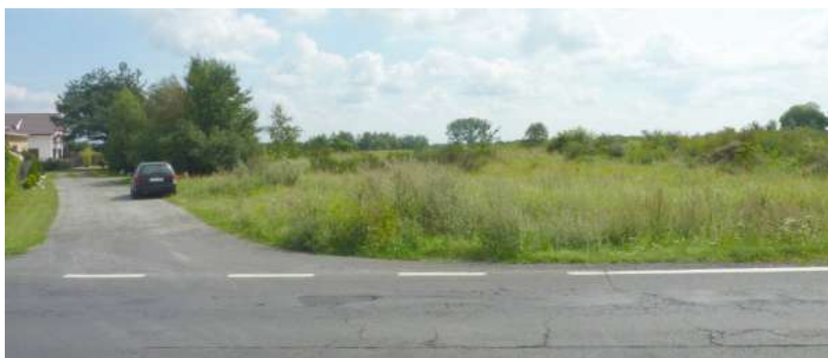
Widok od strony ul. Krotoszyńskiej na północną część terenu.